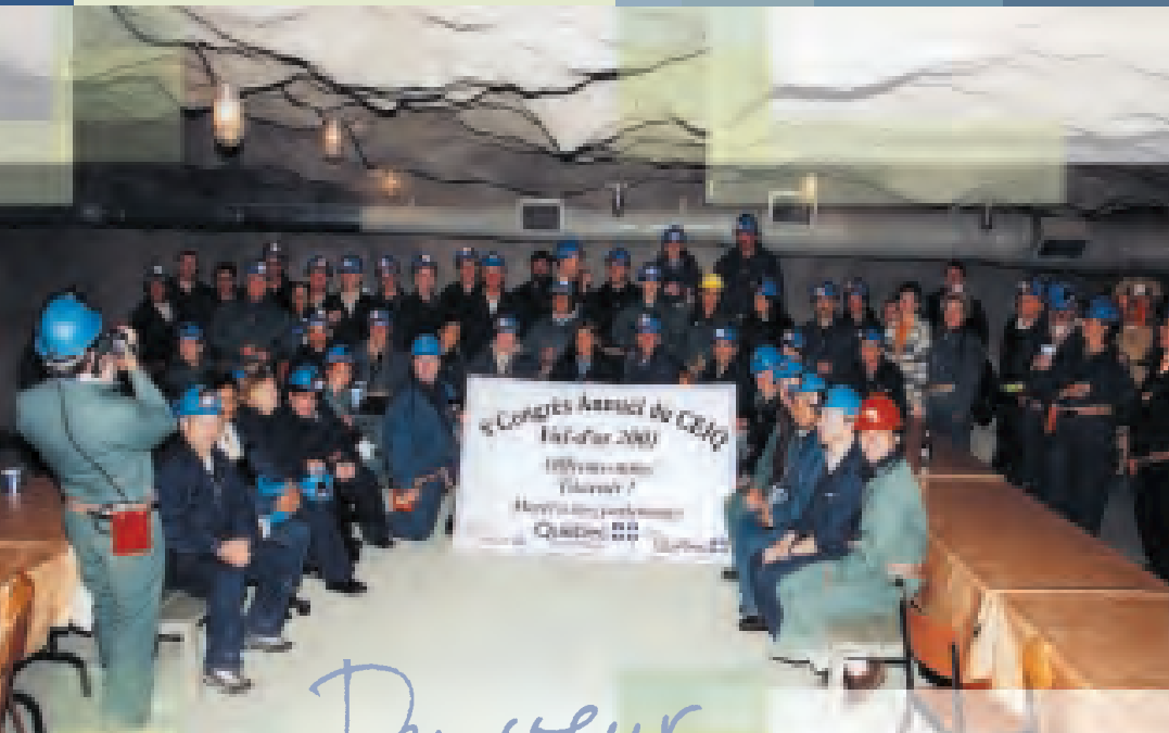
CONGRÈS 2003 À VAL D'OR

Collectif des entreprises d'insertion du Québec